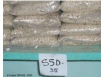
Semences de la SSD-35 (1 kg) en vente par l'Entreprise "Semencière Ahéri", Douchi, Niger, 2008