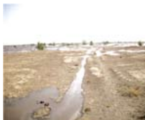
La rentrée d'eau dans le lac Faguibine, zone de production du sorgho de décrue